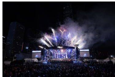
太古「港樂·星夜·交響曲」2023 於中環海濱舉行